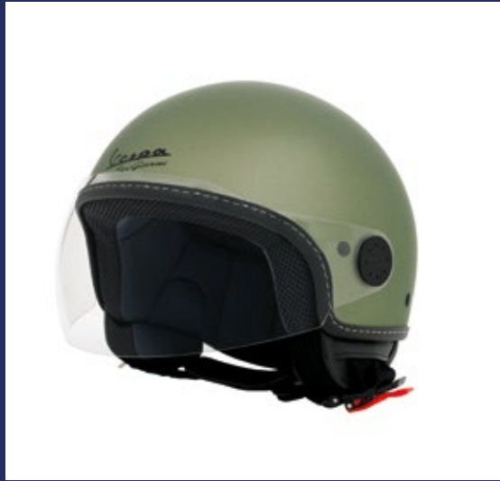
CASCO LIMITED EDITION